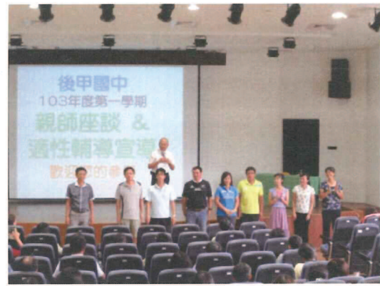
校長介紹適性輔導行政團隊