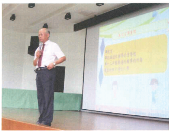
校長宣導適性輔導的重要性