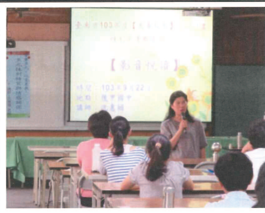
講師說明多元性別特質的內涵