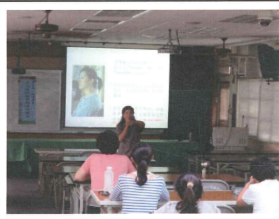
講師與老師們討論議題