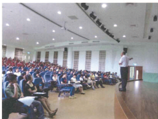
校長與老師們經驗分享