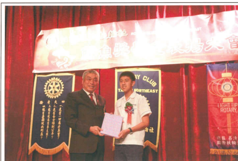
東北扶輪社公開表揚