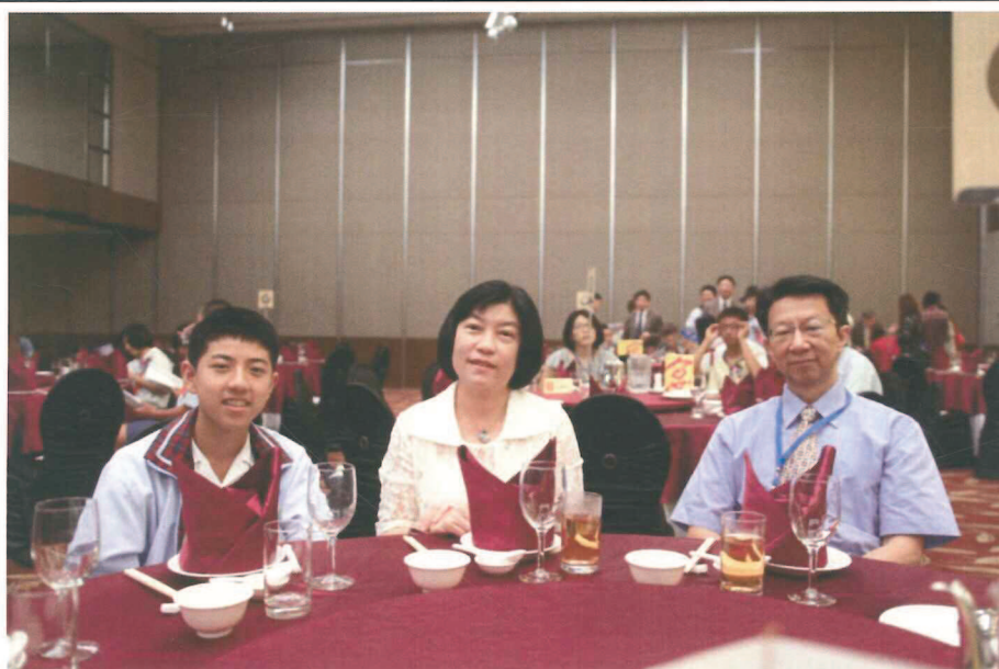
林同學與父母親合影紀念